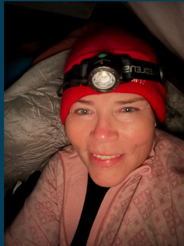
Erä- ja luonto-opas